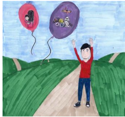
איור: ליאת פליישמן - י'4

הוא נמצא במחשבות שלי. כשאני רוצה לדבר עם מישהו, לעשות משהו, לבכות למישהו - החור הזה תמיד נמצא שם. איבדתי אותך והחור הגדול שיצרת כשהלכת מלווה אותי לכל מקום אליו אני הולך