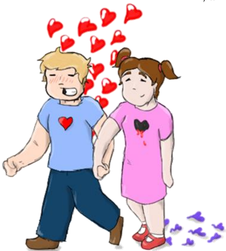
מאור ספינדי - י'ב 2

ולמרות זאת, אולי תמיד היית שלמה ולא היה כל טעם לעשות כזאת מהומה זה נשמע רומנטי תמיד סוג של קלישאה לגבי העתיד