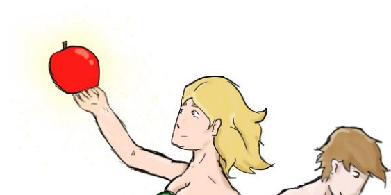
מאור ספינזי – יב2

אך, אני יודעת ש ידעה גם ידעה חכמה ופיקחית הייתה זו חווה שממנה קורצנו כולנו, בנות חווה